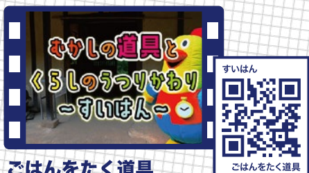
ごはんをたく道具

動画をみるときは、先生や保護者に相談しましょう。授業中に見るときは音声がでないようにするなど、まわりの人に気をくばりましょう。