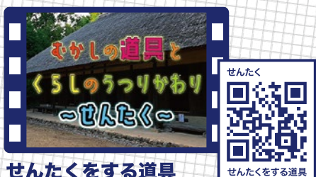
せんたくをする道具