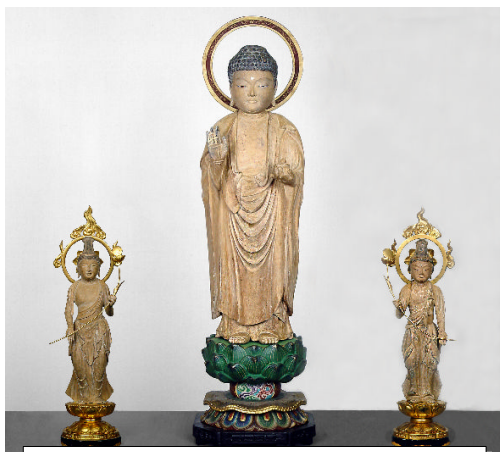
上) 勝國寺の木造薬師三尊像