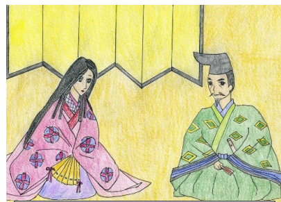
創作歴史紙芝居「蒔田城さき姫ものがたり」／