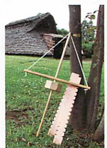
まいぎり式火起こし器 3,150円(税込) (説明書・火きり板(2枚)付属)

今年の春からショップで販売している「まいぎり式火起こし器」。おかげさまで大好評をいただいております。腕の確かな職人さんに作っていただいているので、出来にむらがなく、どれを買っていただいても良く火がつくんです。