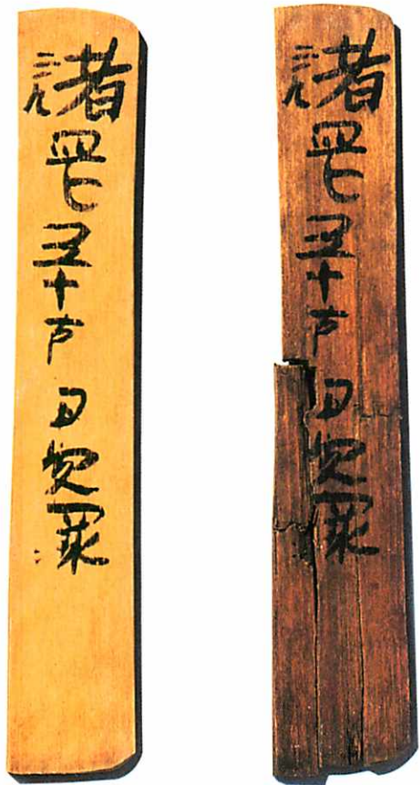
「諸岡五十戸」木簡（複製、左は復元複製資料） 「岡」の字は「四」に「止」を合わせた形の異体字