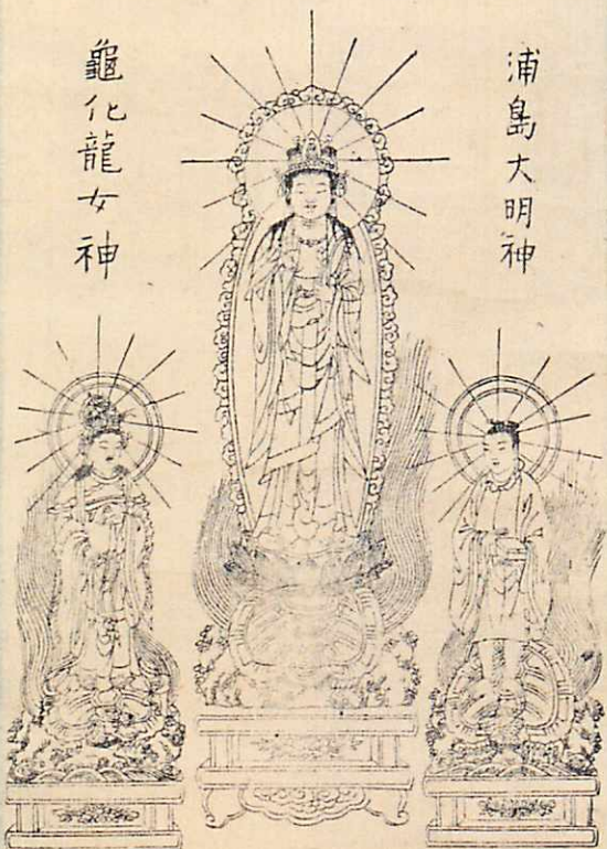
武州樹郡神奈川別當所護國山觀音寺