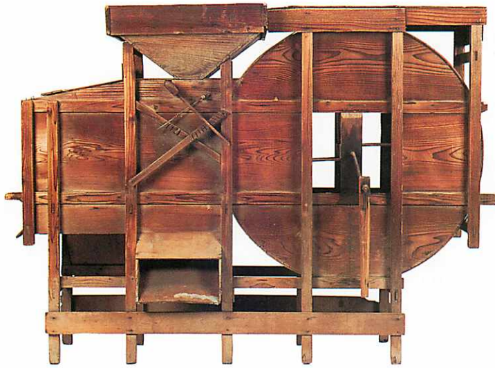
写真① 唐箕 幅167×高121×奥行61センチメートル 港北ニュータウン歴史民俗調査団旧蔵

写真①は横浜市都筑区、開発前の港北ニュータウン周辺で使われてきた唐箕です。大正から昭和初期にかけて製作されたと考えられ、唐箕としては大型のもので、写