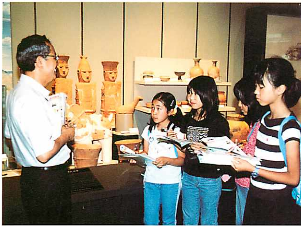
常設展示室で「横浜の歴史と日本の動き」を活用している場面

一つ目は、子どもたちが常設展示室を見学するときに参加していること。二つ目は、子どもたちにもっとも身近な担任の先生方に、博物館のことをよく知ってもらおうことです。そのための博物館利用