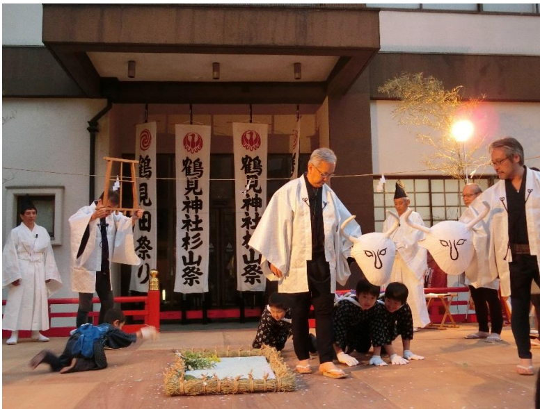
（写真 4）鶴見の田祭り