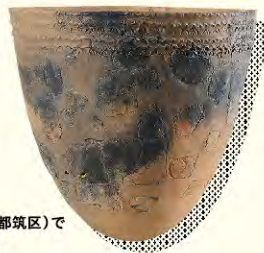
花見山遺跡(都筑区)で出土した土器