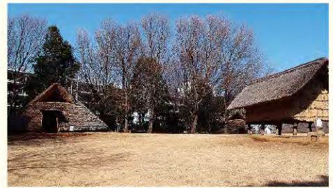
現在の大塚遺跡(都筑区)