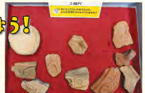
さわれる土器の一例