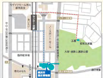
駐車場あり(1時間200円)