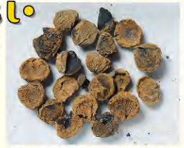
華蔵台遺跡(都筑区)で出土した葉