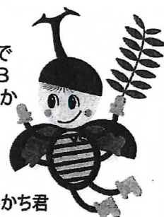
マスコット さいかち君

横浜市歴史博物館の遺跡公園で ボランティアでガイドをしたOB と現役の展示解説ボランティアか らなる任意団体です。