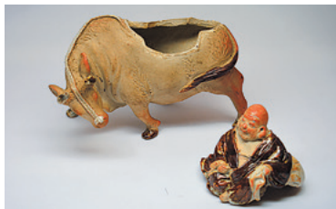
仁清意牛布袋香炉 横浜開港資料館所蔵

横浜を起点に海外へ向けて輸出された輸出品・工芸品に着目した展示として、横浜眞葛焼、横浜芝山漆器、横浜彫刻家具、横浜輸出スカーフをとりあげます。