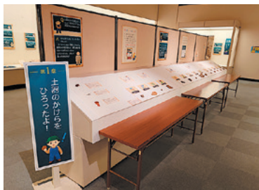
会場イメージ(2023年度)