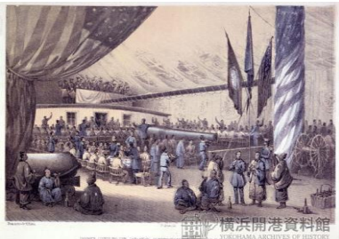
ポーハタン号上後甲板での 宴会の様子