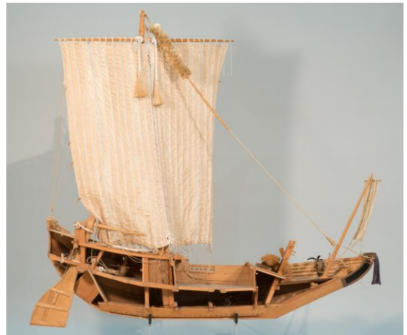
弁才船の内部構造模型 神奈川大学日本常民文化研究所所蔵

江戸時代の横浜をめぐる和船（千石船や高瀬船）の忠実な復元模型と、船を写した古写真・浮世絵で、横浜に関係する江戸時代の船をビジュアルに紹介します。