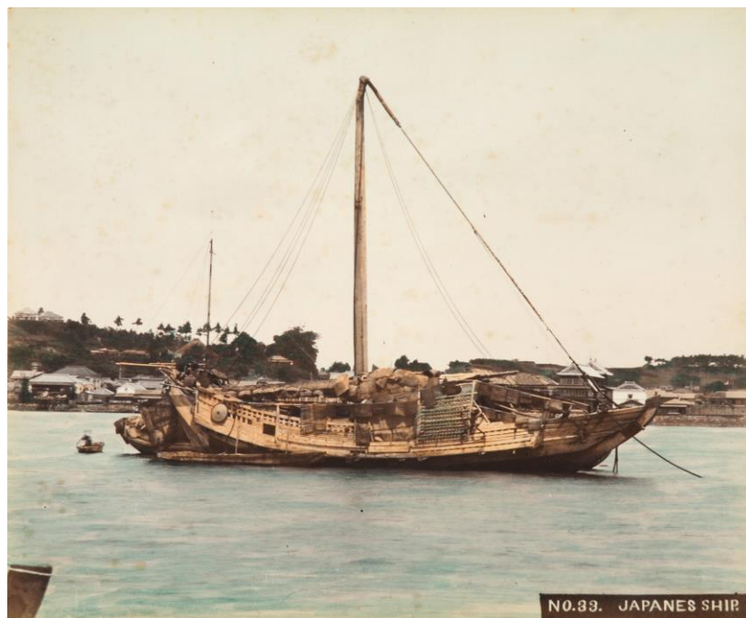
神奈川沖の和船 明治期