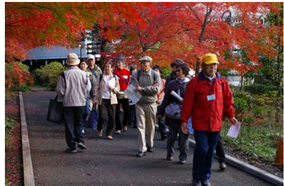
市民団体との共催講座