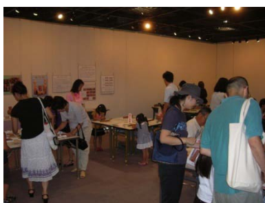
「リリスの大冒険」での展示