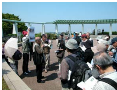
ふるさと横浜探検