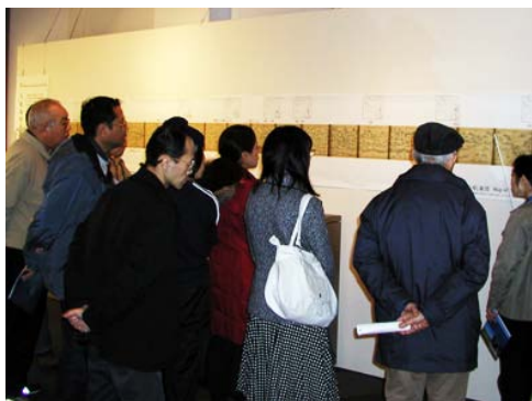
ギャラリートーク