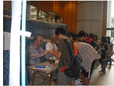
火起こし疑似体験（事業支援ボランティア）