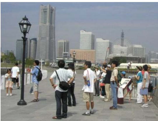
夏休み子どもウォーク