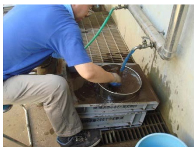
緊急雇用創出事業