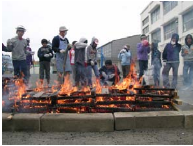
出張授業の様子（土器づくり）