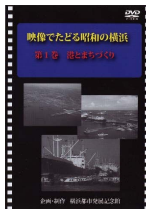
DVD「映像でたどる昭和の横浜」