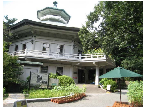
横浜市八聖殿郷土資料館 初夏