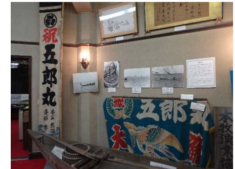
上：かつて本牧の海で活躍していた漁船・五郎丸の幟と大漁旗